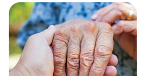
Pflege zu Hause